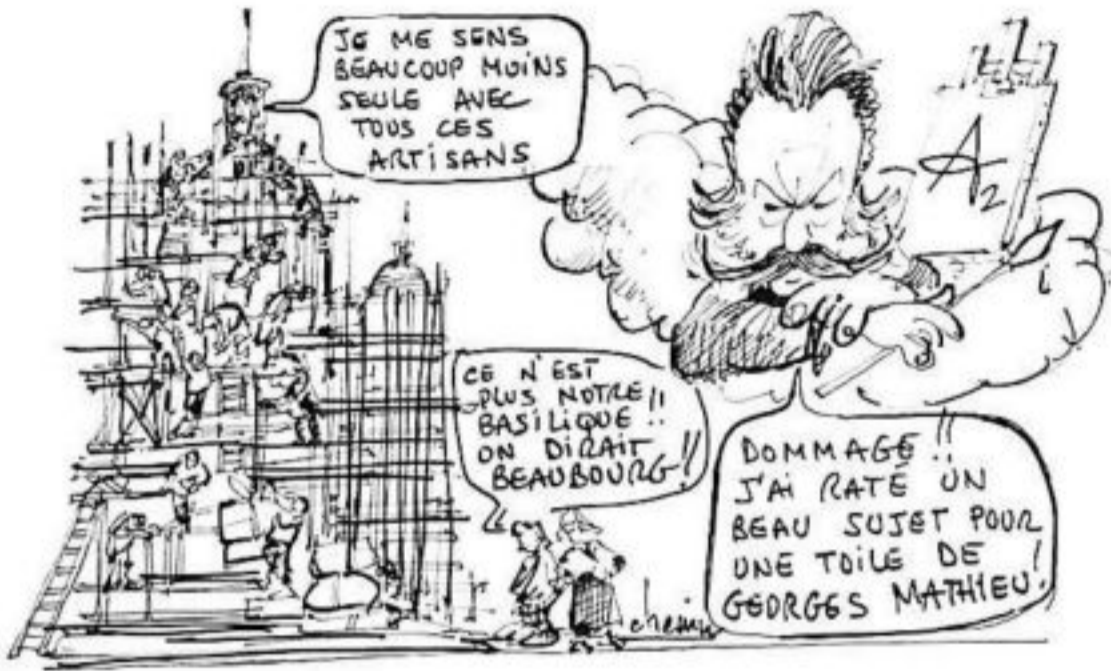
Il reste encore une bonne année de travaux pour la basilique-cathédrale Notre-Dame de Boulogne. Un chantier titanesque, véritable prouesse artisanale et technique, dont nous vous raconterons les coulisses cette semaine.