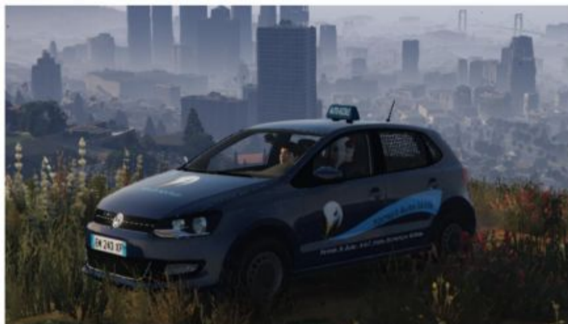
Prendre des cours à la Topher auto-école, boire de la 8.6 ou trainer dans les ruelles de Capécure, le serveur reprend l'univers satirique de Boulogne City Gang.

Depuis plusieurs semaines, un Boulonnais s'attaque à une tâche d'ampleur : recréer l'univers de Boulogne City Gang pour le faire vivre dans un serveur de jeu de rôle, sur GTA.