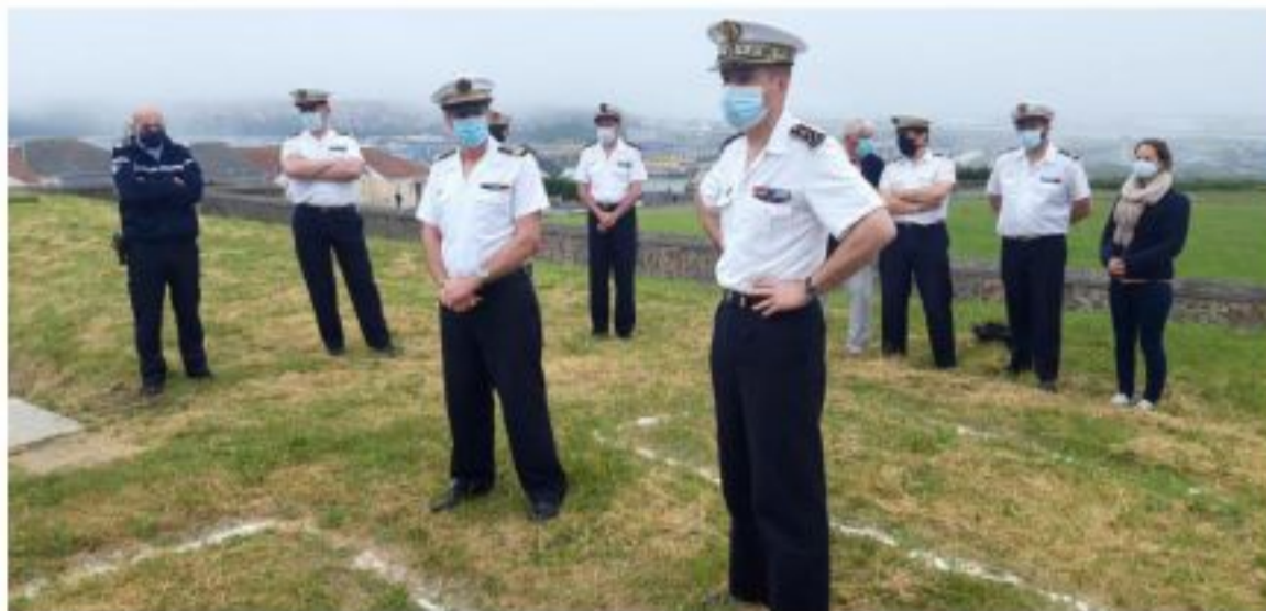
La préfecture maritime avait prévu de faire venir l'hélicoptère du Touquet pour l'occasion, mais le plafond très bas et noageux de Boulogne-sur-Mer, ce 10 juin, en a décidé autrement...