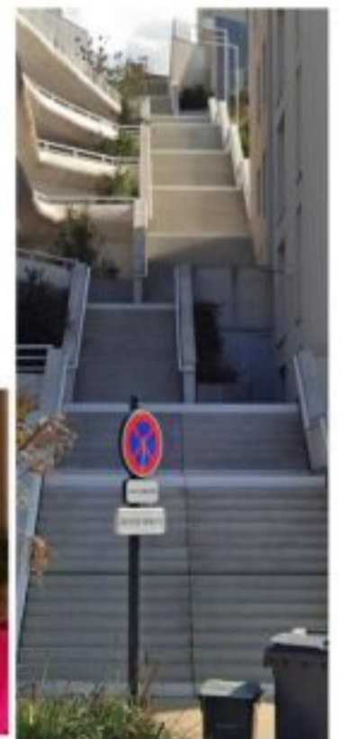
A Boulogne, on a de sacrés raccourcis comme nous l'indiquent nos collègues de Boulogne City Gang.