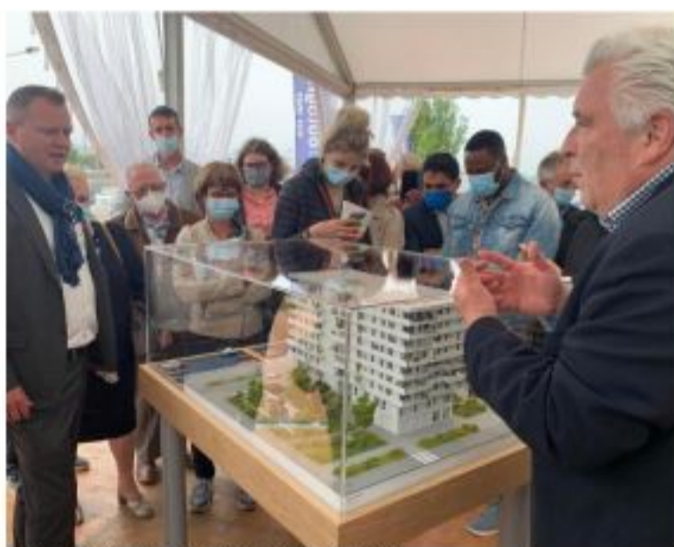
La résidence Mutinot devrait sortir de terre d'ici avril 2024.

des cinq résidences du secteur à proposer des logements accessibles à la propriété (Nldr : les autres résidences étant dédiées à l'activité touristique). Dans le bâtiment de huit étages seront construits 52 appartements allant du T2 (une chambre) au T5 (quatre chambres). « Chaque appartement disposera d'un grand balcon et aussi d'une place de parking, explique-t-on du côté du promoteur immobi-