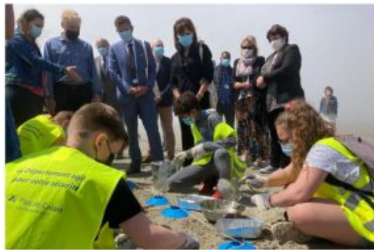
Sur la plage, on procède à des ateliers de nettoyage du sable.

Le mardi 8 juin célébrait la journée mondiale de l'océan. C'est en ce sens que la rectrice de l'académie de Lille Valérie Cabuil s'est rendue à Boulogne-sur-Mer.