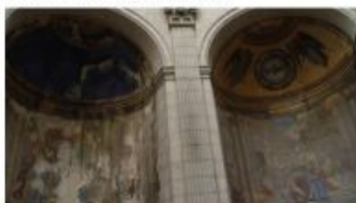
Plusieurs fresques de la cathédrale sont endommagées.

Les six fresques présentent un état de conservation médiocre, en dépit de campagnes de restauration menées en 1889, 1928 et 1976. La Présentation de la Vierge au temple et la Purification sont particulièrement dégradées. Les travaux devraient commencer