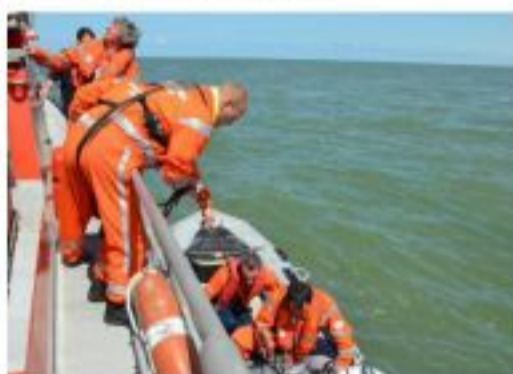
Depuis huit ans, la SNSM avait une équipe chaque été affectée à la baie de Wissant.