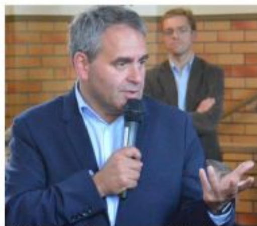
Xavier Bertrand s'est ménagé un espace entre Le Pen et Macron.

Le marquage sur l'homme est fort. Pas moins de quatre ministres sont sur la même liste pour empêcher Xavier Bertrand d'être reconduit à la présidence des Hauts-de-France. User d'autant de forces et qui plus est, de membres du gouvernement, dénote deux choses. D'une part, l'enjeu est élevé au plan national. D'autre part, l'équipe du président de la République ne part pas gagnante. Pourquoi faire de Xavier Bertrand l'homme à abattre et prendre le risque de ne pas y parvenir ? Parce qu'il est celui qui fait peur pour la présidentielle de 2022. En politique, tout peut changer très vite. Mais à ce jour, c'est le seul candidat proposant l'envergure suffisante pour redonner un axe à la droite classique. Avec ce tour de force : il n'est plus membre d'un parti. Marine Le Pen ne prend d'ailleurs pas le risque d'une nouvelle défaite face à lui aux Régionales. ■