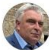
FRÉDÉRIC CUVILLIER, MAIRE DE BOULOGNE- SUR-MER

« Un des chantiers les plus importants de la région »