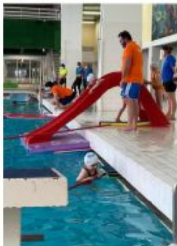
Ce dispositif est destiné aux petits.

C'est un partenariat complet qui a été mis en place entre le Swimming Club Boulonnais, l'Éducation Nationale et la ville pour promouvoir l'aisance aquatique chez les plus jeunes. Boulogne-sur-Mer a mis en place, pour la toute première fois, le dispositif national « J'apprends à nager ». Celui-ci permet d'emmener les élèves, âgés de 4 à 6 ans, à la piscine chaque jour pendant deux semaines. Le but de cette initiative est d'acquérir une certaine aisance dans l'eau et donc de faciliter leur futur apprentissage de ce sport. La natation, ce n'est pas quelque chose d'anodin pour la ville de Boulogne-sur-Mer, « nous en avons fait une de nos priorités », affirme Gery Quennesson, inspecteur de l'Éducation Nationale. C'est d'ailleurs grâce à la mobilisation de tels moyens que Boulogne-sur-Mer possède les meilleurs résultats dans les indicateurs en termes de natation. C'est alors, avec 14 éducateurs de la Ligue régionale de natation que les élèves apprennent à ne plus avoir peur de l'eau, ainsi que les bons