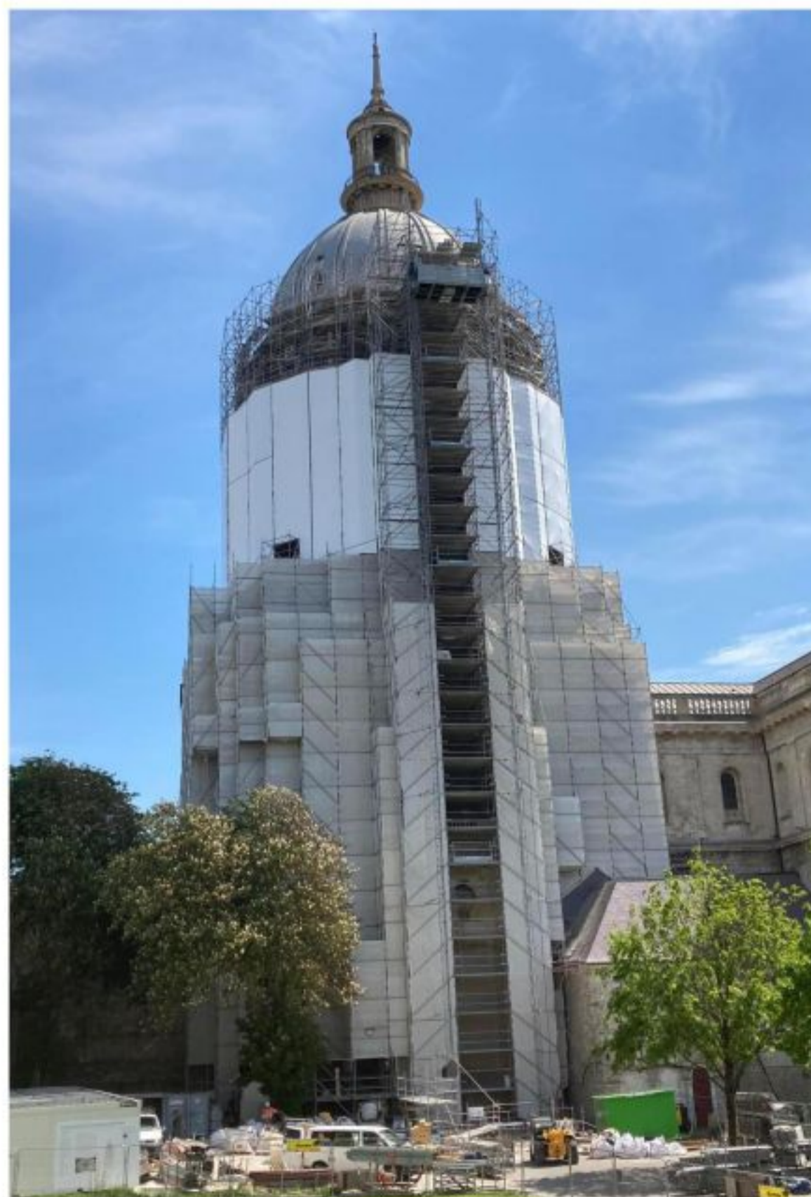
L'échafaudage de 54 mètres de hauteur recouvre la basilique d'un manteau de métal et de bâches.

Démarré en septembre 2020, le « chantier du siècle » de réfection de la cathédrale Notre-Dame devrait s'achever d'ici fin 2022. Plongez au cœur d'un chantier impressionnant.