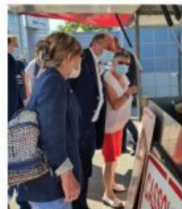
Accompagné de militants et de députés du département, le candidat est allé à la rencontre des Boulonnais.