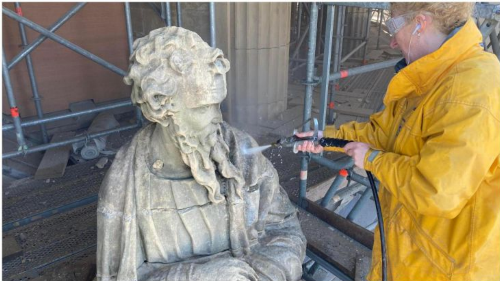
L'utilisation d'un karcher est nécessaire pour nettoyer les statues, avant d'utiliser un scalpel hydraulique pour les finitions.

coffrage ne soit mis en place pour couler du béton neuf, afin de moderniser la ceinture.