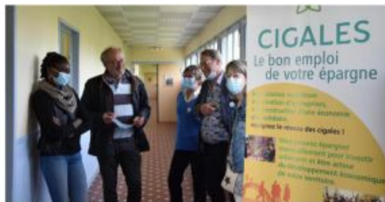
Le club Cigales de Boulogne organisait une opération ce samedi.

Ce samedi 12 juin, l'opération « Cigales cherchent Fourmis et Cigaliers », organisée par le club Cigales de Boulogne, a eu lieu au sein de la maison des associations de Boulogne-sur-Mer.